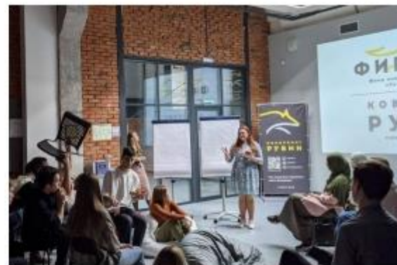
Пример организации дискуссии