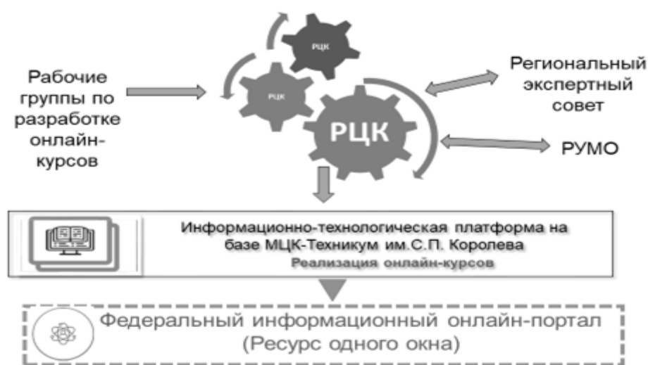
Рисунок 1. Процесс разработки и оценки качества онлайн-курсов

Процесс разработки и оценки качества онлайн-курсов отражен на рисунке 1.