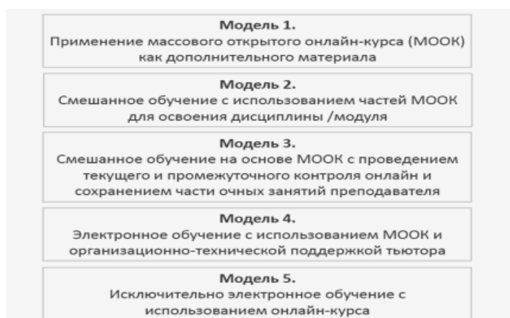
Рисунок 2. Модели использования онлайн-курсов

На сегодня в системе профессионального образования реализуются несколько моделей встраивания онлайн-курсов в образовательный процесс (рис.2).