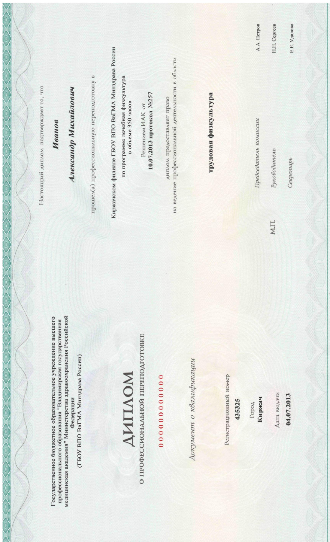
Рисунок 11. Пример заполнения бланка диплома о профессиональной переподготовке на право заниматься определенной профессиональной деятельностью