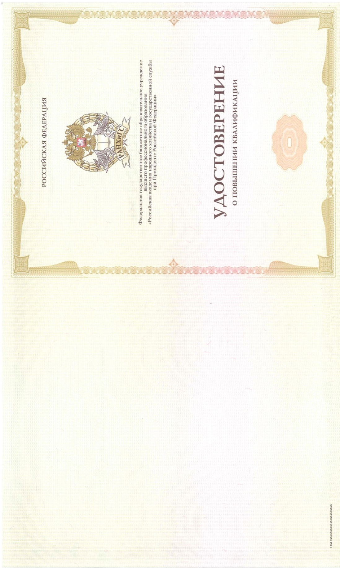
Рисунок 4. Применение логотипа образовательной организации на бланке удостоверения о повышении квалификации