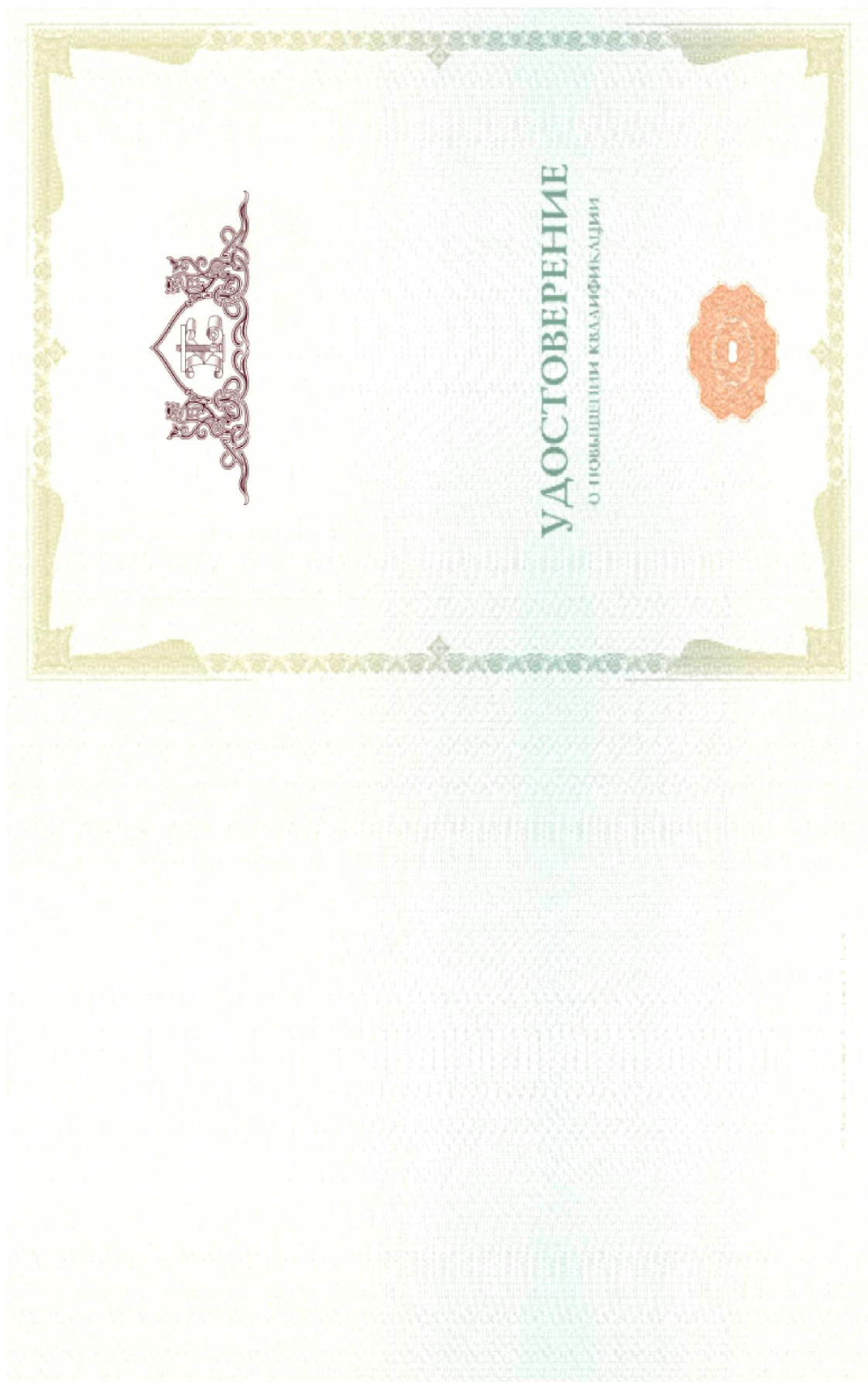
Рисунок 3. Применение логотипа образовательной организации на бланке удостоверения о повышении квалификации