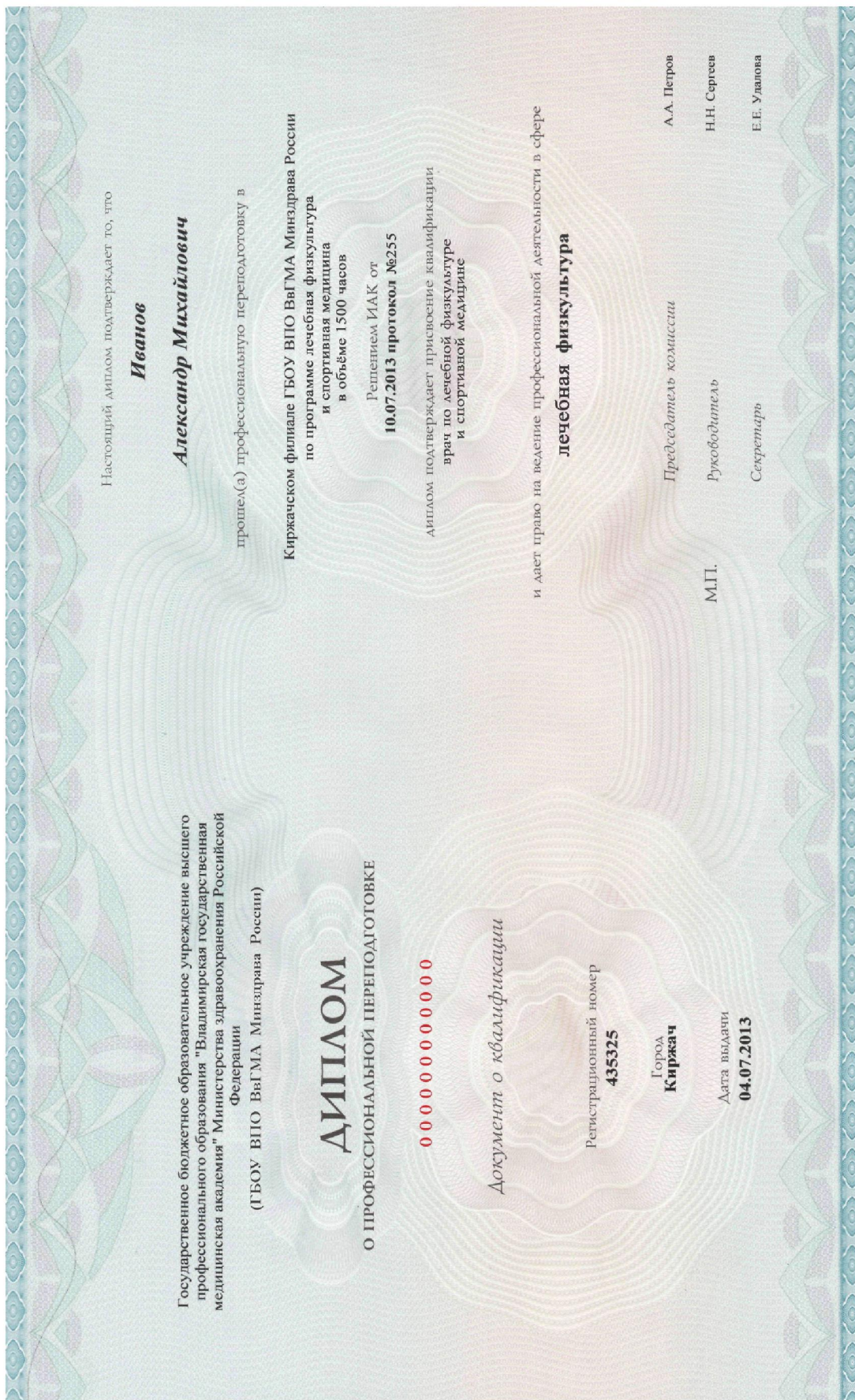
Рисунок 12. Пример заполнения бланка диплома о профессиональной переподготовке с присвоением квалификации