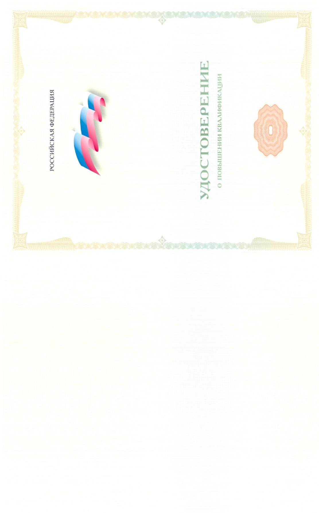
Рисунок 2. Применение стилизованного изображения Государственного флага РФ на бланке удостоверения о повышении квалификации