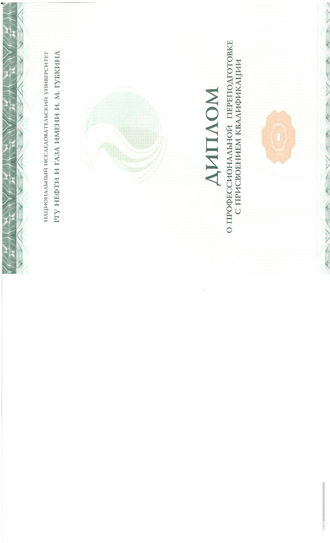
Рисунок 5. Применение логотипа образовательной организации на бланке диплома о профессиональной переподготовке с присвоением квалификации