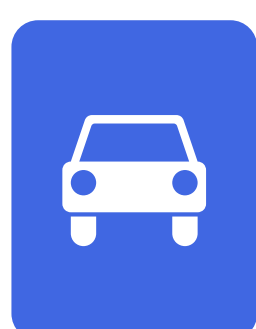
Дорога для автомобилей