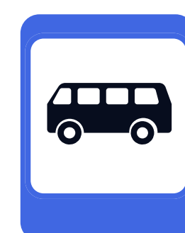
Место остановки общественного транспорта