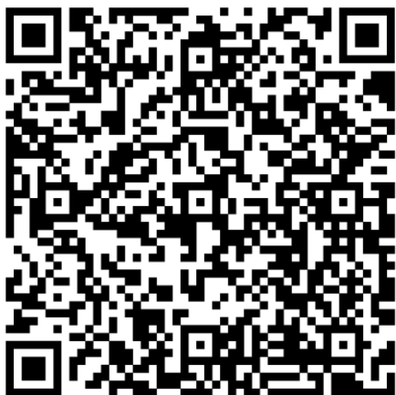
Сборники Методических рекомендаций