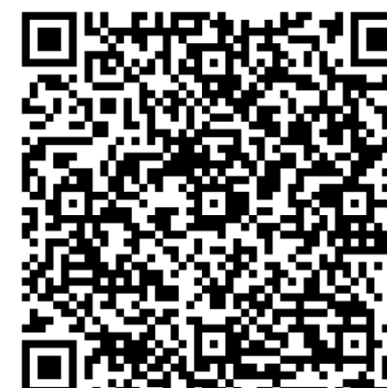
Чек-лист классного руководителя Психологическая готовность обучающихся к ГИА