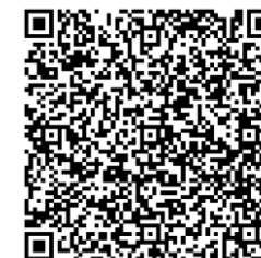
Годовой план работы психолога (форма)

Текущая документация – индивидуальная папка обучающегося, находящегося на психолого-педагогическом сопровождении, включает в себя: копию заключения ТПМПК /коллегиальное заключение ППк, справка МСЭ (копия), ИПРА (копия при наличии); результаты индивидуальных диагностических обследований; копию согласия на психолого-педагогическое сопровождение